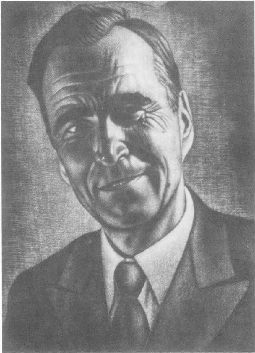
Іван Кейван: Поет і письменник Тодось Осьмачка

С Р У С Ц Т Н В В Н Н П Б Н Д С Л В Н З Т С В С Т Т З О